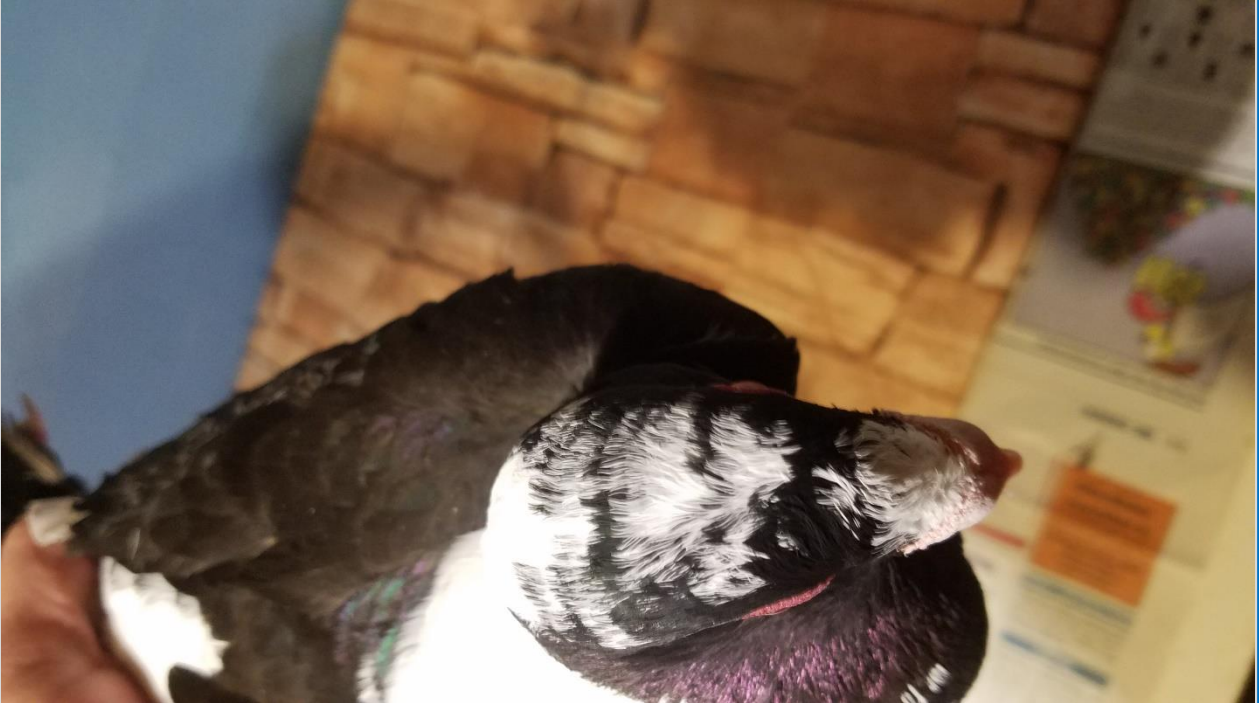
Bilder Zuchtfreund Ettengruber, Rasse Huhnscheck