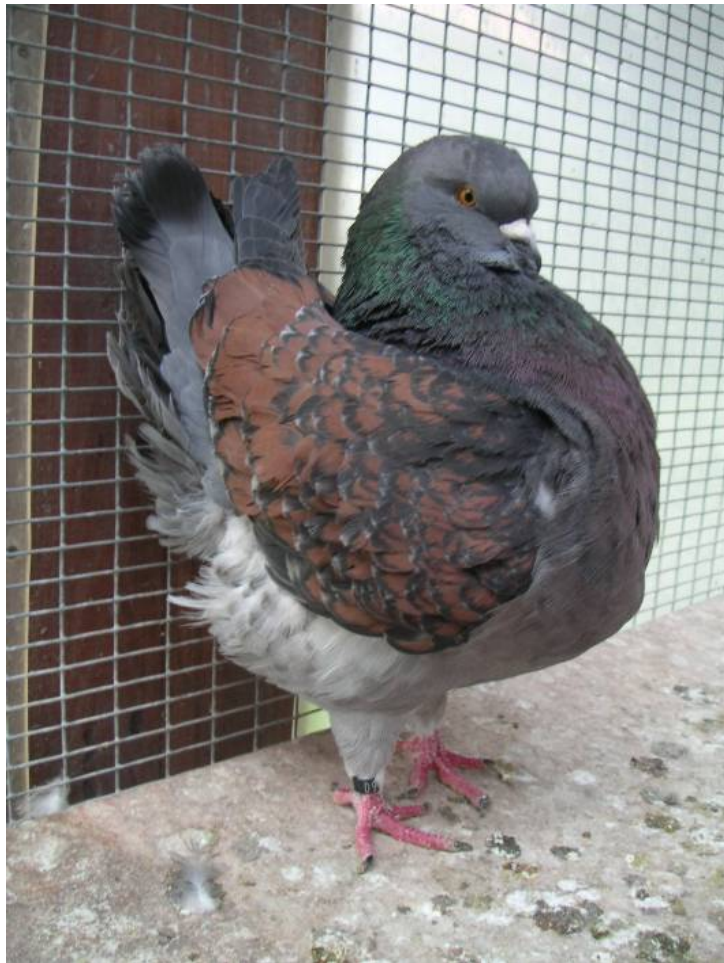
- CZ 644 Champion -

Ein Täuber im Blau br. gehämmerten Farbschlag wobei nach heutigen Wünschen die Hämmerung und die Unterfarbe korrekter erwartet wird. Dieses Problem zieht sich bis heute durch meine Zucht.