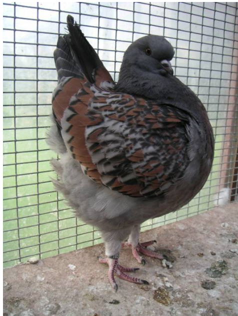
Jung 0,1 2008

Ob dieses mit dem Schaltjahr zu tun hat ? Wie auch immer, dann geht es eben in kleinen Schritten weiter. Die ersten Jungen aus 2008 zeigen teilweise schon für meine Verhältnisse eine bessere aufgehellte Hämmerung und saubereres Untergefieder. Wie sie sich figürlich entwickeln, bleibt abzuwarten.