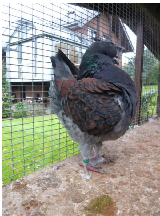
- Täuber 48 -

Selbstverständlich fallen hin und wieder Tauben mit zu dunkler Hämmerung und unsauberem Untergefieder. Wenn jedoch die Figur stimmt, - wie z.B. bei dem untenstehenden Jungtäuber aus dem Herbst 2007 mit noch 5 Schwingen - gebe ich ihm die Chance, mit einer helleren Partnerin farblich korrektere Tiere zu zeugen.