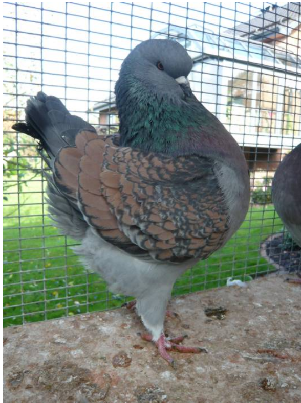
-Täuber 27 -

Selbstverständlich fallen hin und wieder Tauben mit zu dunkler Hämmerung und unsauberem Untergefieder. Wenn jedoch die Figur stimmt, - wie z.B. bei dem untenstehenden Jungtäuber aus dem Herbst 2007 mit noch 5 Schwingen - gebe ich ihm die Chance, mit einer helleren Partnerin farblich korrektere Tiere zu zeugen.