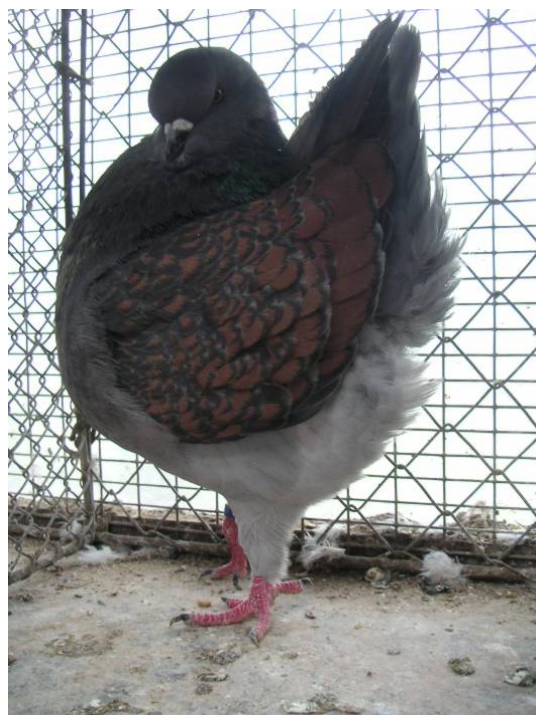
- Täubin 542 -