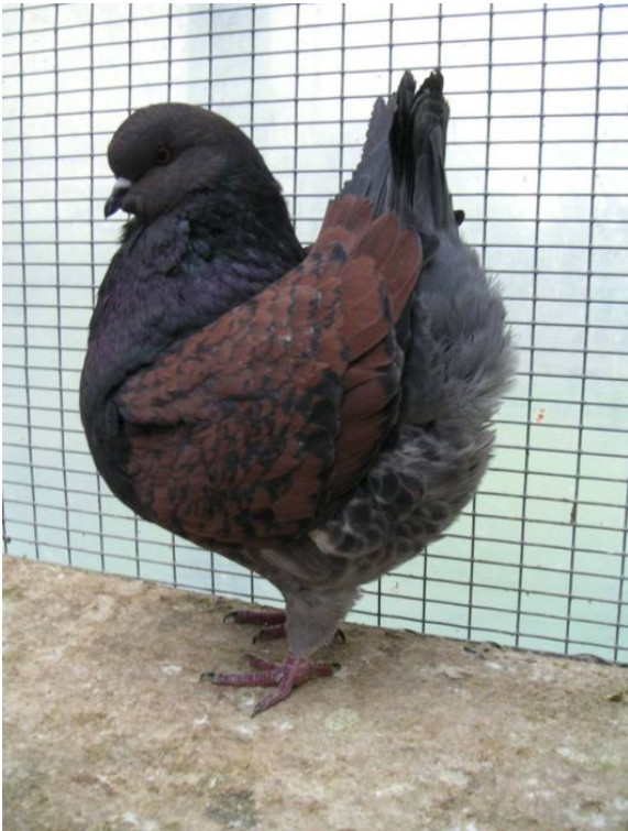
- Täubin 557 -

Hatte ich zunächst mit der Nachzucht guter Täuber so meine Probleme, konnte ich mich über figürlich gute Täubinnen freuen. Aber auch hier hatte ich das farbliche Problem wie es die nachstehenden Täubinnen zeigen :