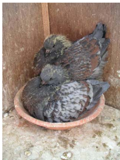
2 Junge in der Schale