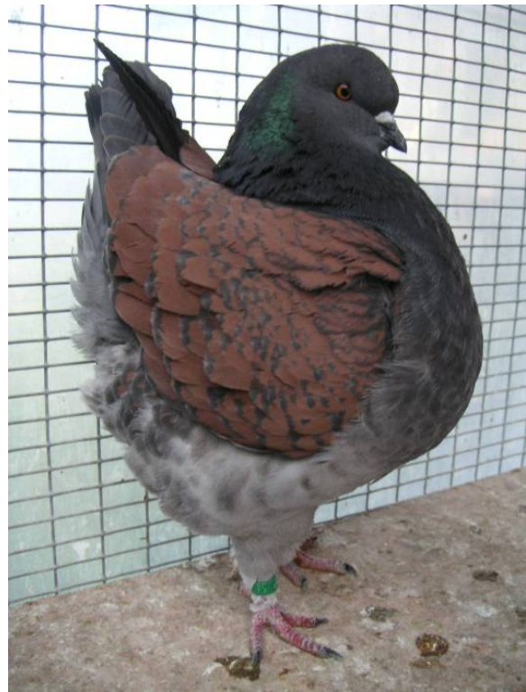
- Täubin 54 -